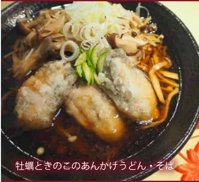
牡蠣ときのこのあんかけうどん・そば