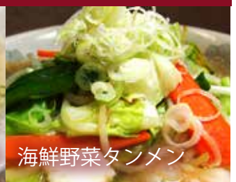
海鮮野菜タンメン