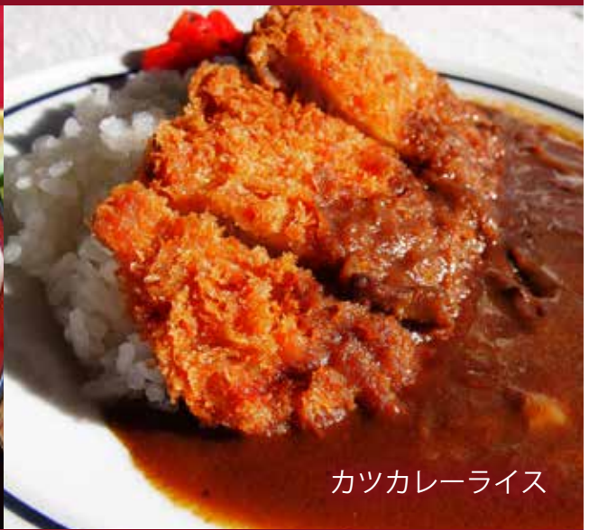
カツカレーライス