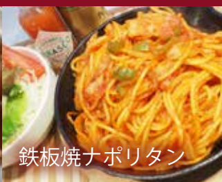
鉄板焼ナポリタン