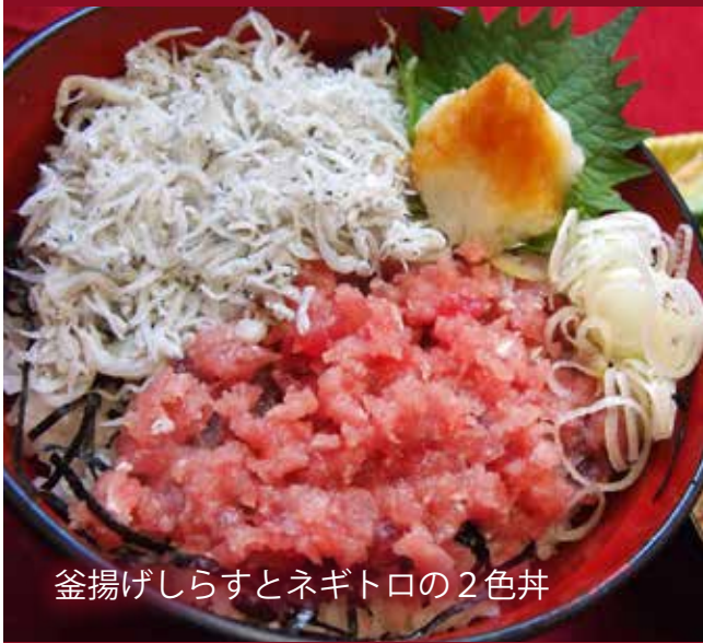
釜揚げしらすとネギトロの2色丼