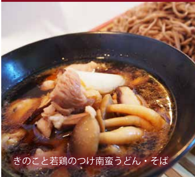
きのこと若鶏のつけ南蛮うどん・そば