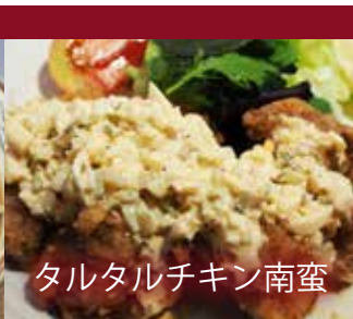
タルタルチキン南蛮

定食ご希望の場合は、定食セット190円を別にお買い求めください。(ご飯、みそ汁、漬物)