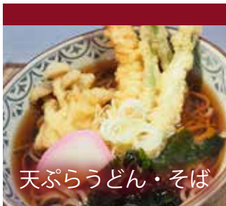
天ぷらうどん・そば