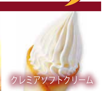
クレミアソフトクリーム